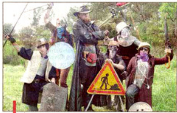
Attention ! Monfron et ses guerriers sont dans les parages... Les auteurs des "Sudistes" osent et se moquent !

Aujourd'hui, en attendant une projection en public au Comedia au printemps prochain des derniers épisodes, les deux jeunes artistes espèrent pouvoir diffuser Les Sudistes ailleurs que sur la toile et veulent peaufiner leur travail. Pour cela, ils sont à la recherche de musiques pour la bande-son et d'intographistes pour booster leurs effets spéciaux. Valérien réfléchit enfin à une déclinaison en BD : reste à trouver un éditeur. M.M.y