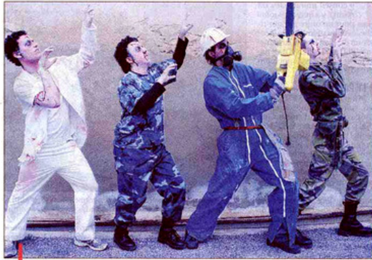
De drôles de zombies rodent dans les rues d'Aubagne... et ce n'est pas tout : un ovi aurait été aperçu au sommet de Garlaban. Les scénaristes des "Sudistes" ont une sacrée imagination !