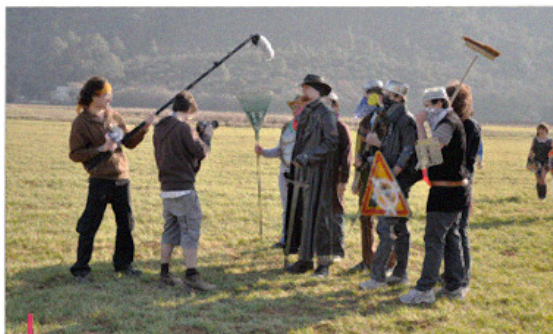
D'étranges créatures se battent contre des héros de bande dessinée : non, ce n'est pas carnaval mais le tournage de la web série : "Les Sudistes".